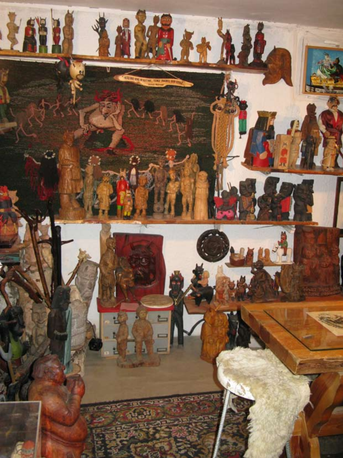
Muzeum Diabła Polskiego „Przedpiekle” w Warszawie.