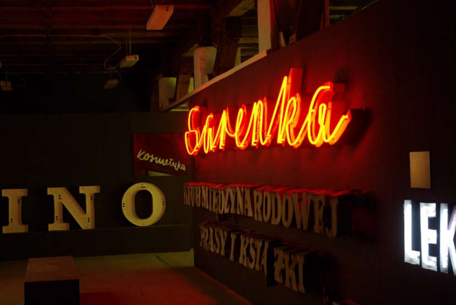
Muzeum Neonu w Warszawie. Świecące (i zgaszone) neony (eksponaty w działaniu).